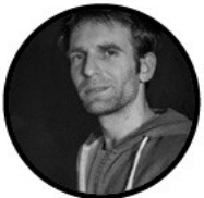
BLAISE S.A.V / BOUTIQUE

Technique : Yves-Marie technique@livefactory.fr / 07.81.55.81.89 Aurélien : regie@livefactory.fr / 06.84.76.22.03