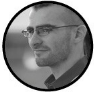
YVES MARIE TECHNIQUE